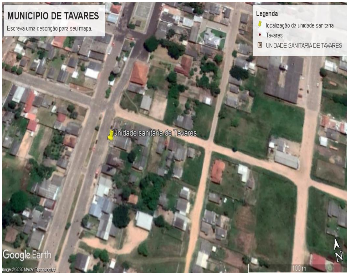
Localização da Unidade sanitária de Tavares