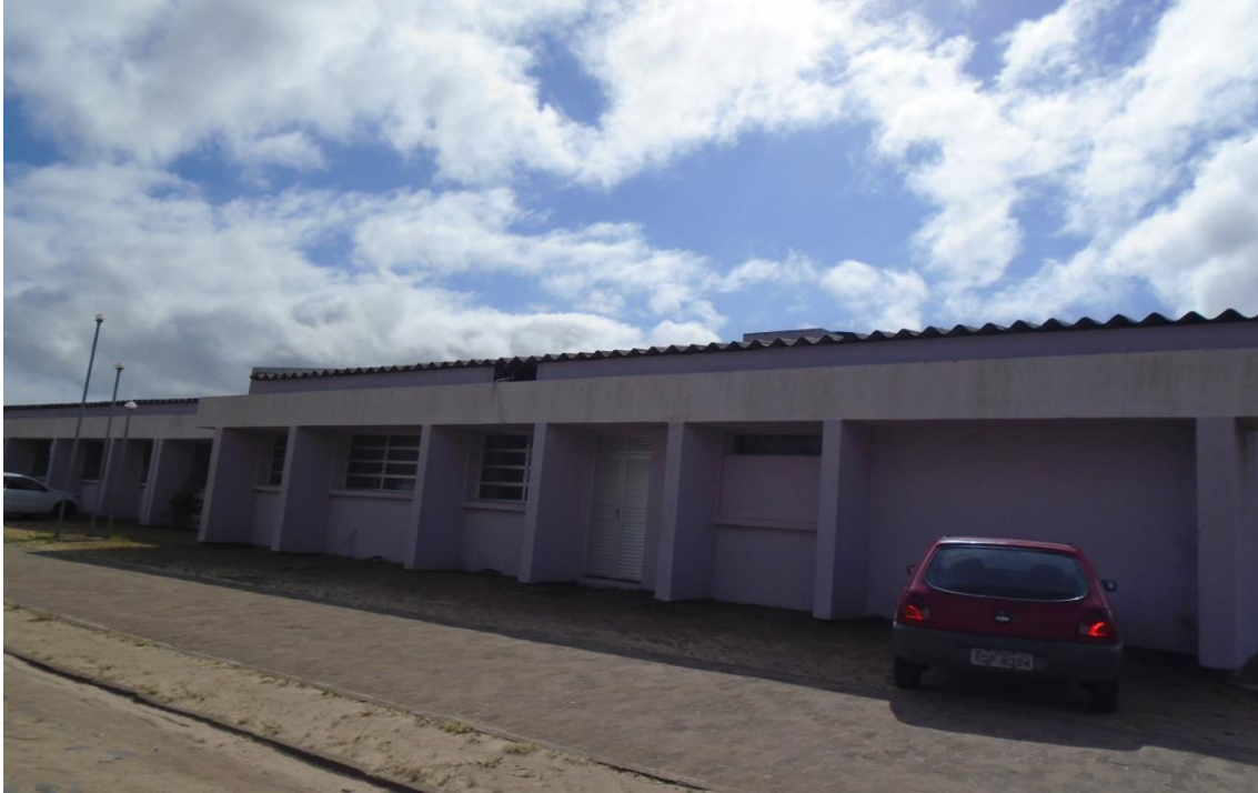
Foto. Pronto atendimento 24 Horas DR. Gilberto Mota Braga

Será disponibilizado um leito isolado podendo ter ventilação mecânica a paciente que chegar apresentando sintoma e que por ventura fique em observação até a regulação conseguir leito em hospital de referência, onde esta sala será restrita a pacientes com sintomas da doença do coronavírus.